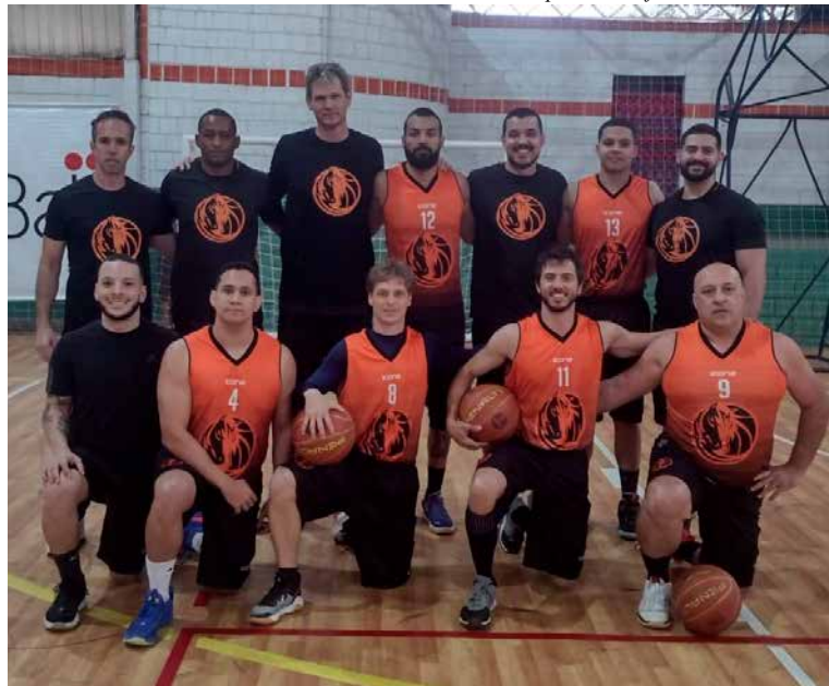
Ball Black Horses: vitória sobre o Conchal Rivers

A competição reúne 12 equipes masculinas da região e é realizada aos domingos, no Ginásio Municipal de Esportes, com entrada gratuita.