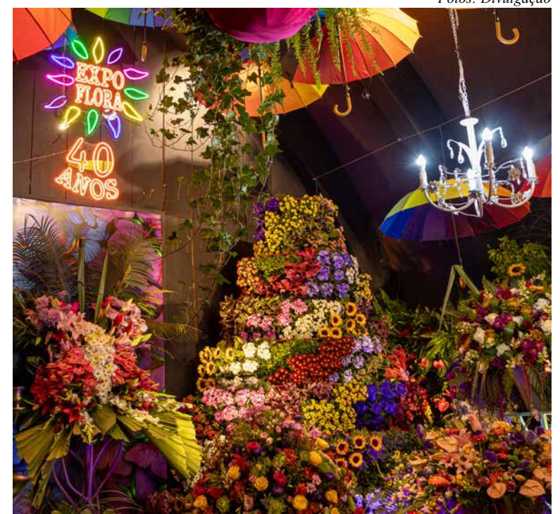
Flores e plantas ornamentais encantam visitantes na exposição de arranjos