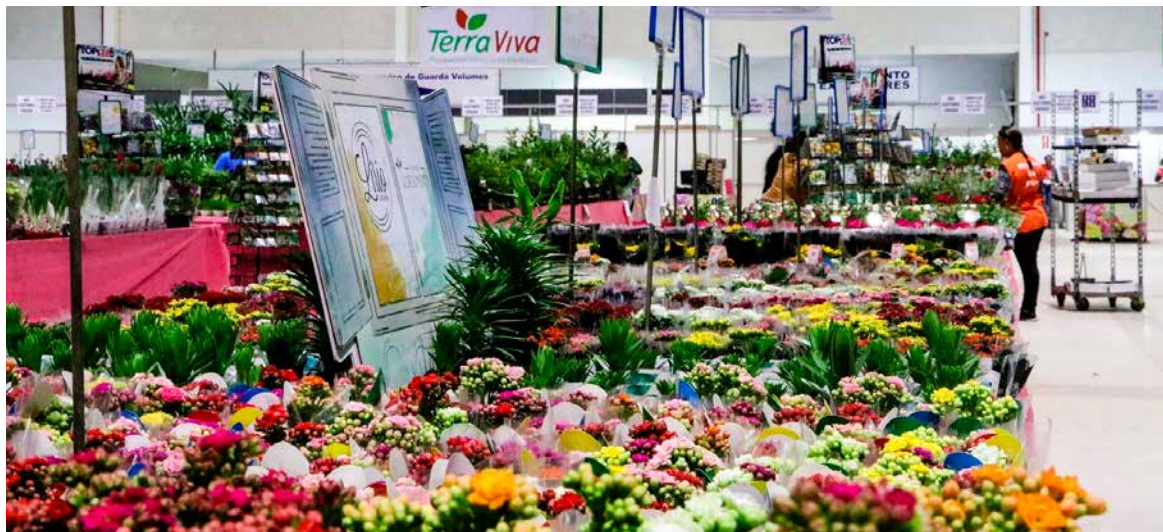
Shopping das Flores: à venda na Expoflora mais de 4 mil variedades e 300 espécies de flores e plantas