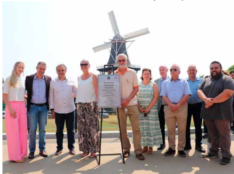
Inauguração da Galeria Cultural e Turística da Praça Wim Welle

Assessoria de Imprensa Prefeitura de Holambra