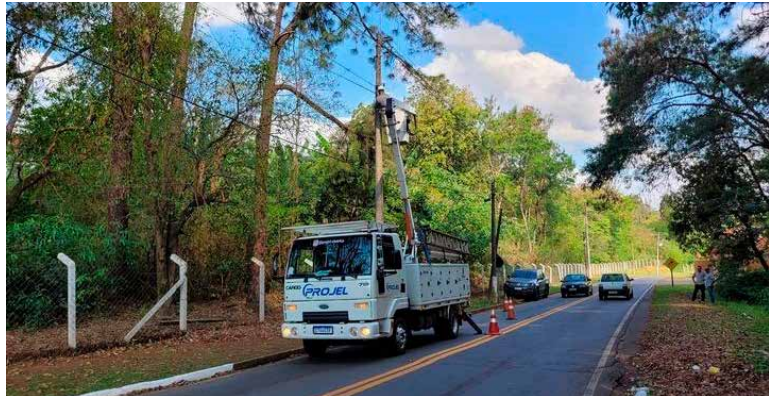
Estradas municipais terão iluminação de LED

Assessoria de Imprensa Prefeitura de Holambra