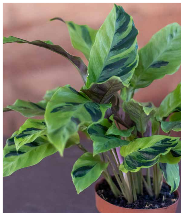
Calathea Fusion Yellow

finalmente chegam ao verde. Seu crescimento é moderado, porte de até 1 metro de altura, bastante aguardada por paisagistas e decoradores.