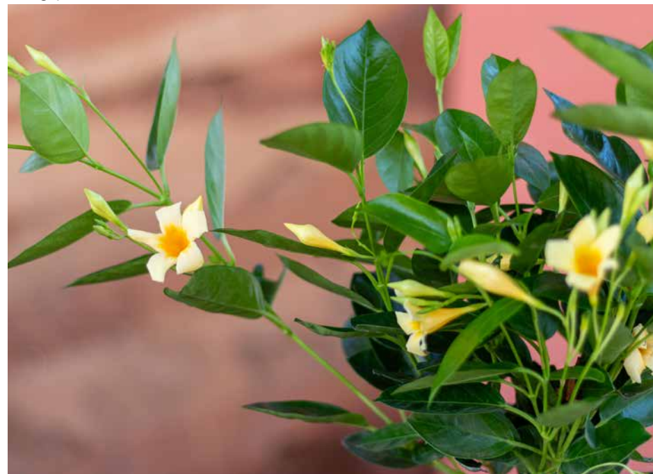
Mandevilla Piccoli, lançamento em flor, da Terra Viva