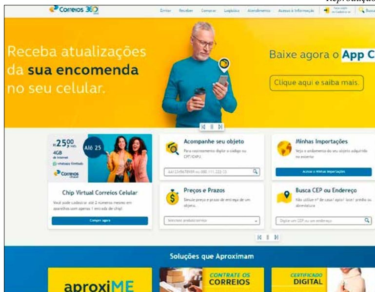
No site dos Correios consulta já inclui os endereços de Holambra