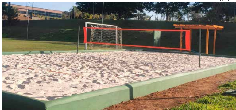
Quadra de areia da Unifaj: estrutura pronta para o Jogos Universitários

grupo UniEduK, é composto pelo Centro Universitário de Jaguariúna (UniFAJ), o Centro Universitário Max Planck (UniMAX) e a Faculdade de Agronegócios de Holambra (FAAGROH), instituições reconhecidas com nota máxima pelo MEC em corpo docente, infraestrutura e Projeto Pedagógico do Curso.