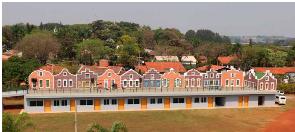
Espaço vai sediar apresentações culturais e será apoio para atividades do Moinho

Assessoria de Imprensa Prefeitura de Holambra