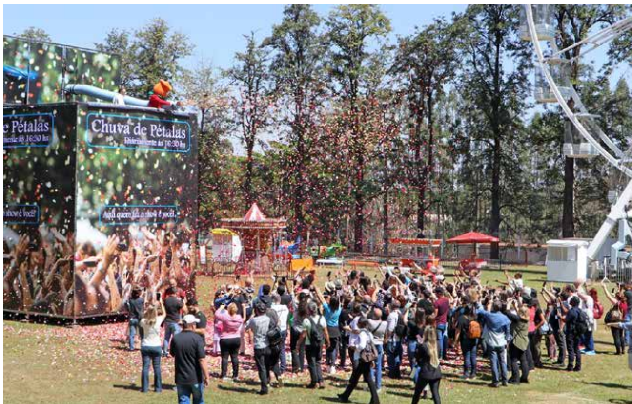
Imprensa foi recebida na Expoflora com chuva de pétalas nesta quinta, 1

Evento será aberto oficialmente hoje, 2 de setembro, a partir das 9 horas para o público.