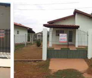
- BORDA DA MATA - Cod. 465