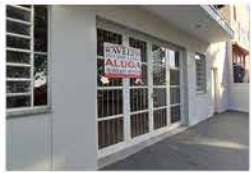
- JD DAS TULIPAS - Cod. 546