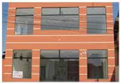
- MORADA DAS FLORES - Cod. 550