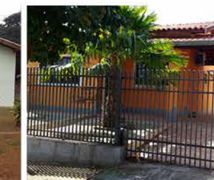
IMIGRANTES - Cod. 450