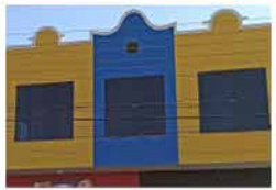
- MORADA DAS FLORES - Cod. 559