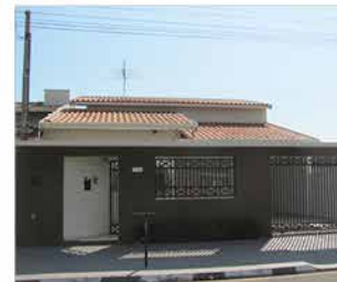
- JD DAS TULIPAS - Cod. 527