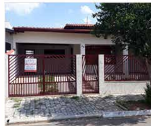
- JD DAS TULIPAS - Cod. 457