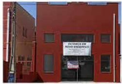
- JD DAS TULIPAS - Cod. 561