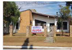
- CENTRO - Cod. 558