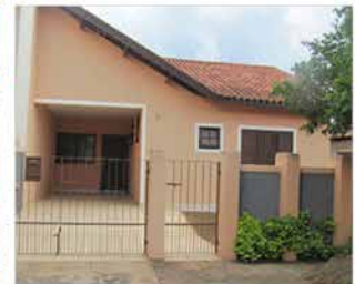
- GROOT - Cod. 555