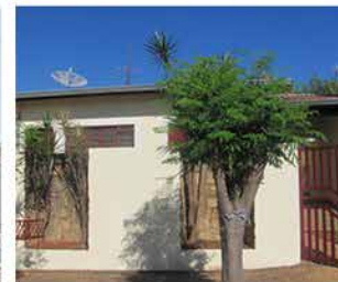
- JD DAS TULIPAS - Cod. 417