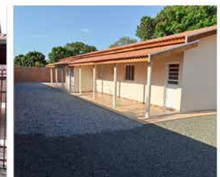
RINCÃO (STO ANT. POSSE) - Cod. 564