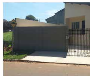
- IMIGRANTES - Cod. 453