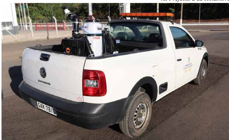
AI Prefeitura de Holambra

A partir do registro de casos positivos, os agentes farão buscas e controle de criadouros do Aedes aegypti em residências que estejam