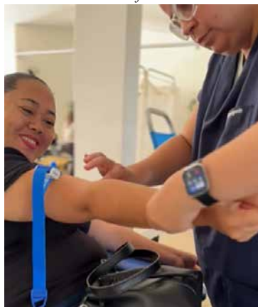
AI Prefeitura de Holambra

Na última sexta-feira, dia 3, foi realizada em Holambra a segunda Campanha de Doação de Sangue do ano, promovida pela Prefeitura em parceria com o Hemocentro da Unicamp. Ao todo, foram arrecadadas 79 bolsas de sangue, e enviadas para hospitais filantrópicos da região. Cada uma pode salvar até quatro vidas. A próxima edição da campanha na cidade está prevista para ocorrer no dia 8 de agosto.