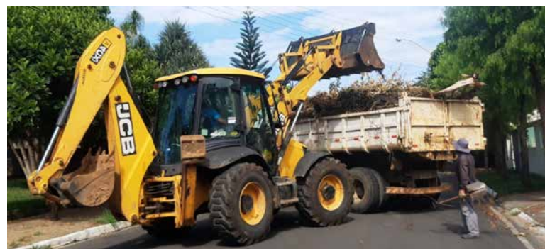
AI Prefeitura de Holambra

Os itens devem ser descartados na frente das residências antes das 7h30, de acordo com o cronograma de bairros (ver abaixo). Lixo doméstico, restos de construção civil e materiais eletrônicos não serão recolhidos neste trabalho. Em caso de chuva a ação poderá ser cancelada.