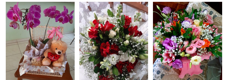
Flores: uma forma para o filho ‘abraçar’ sua mãe nesta data